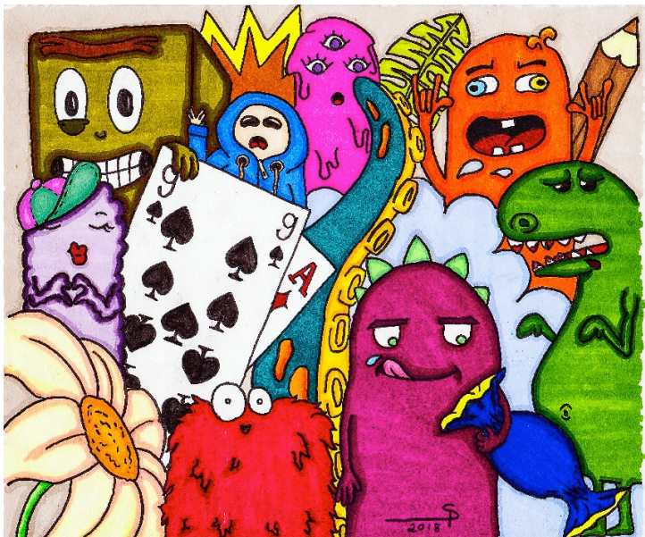
* Ausstellung der Künstlerin vor Ort Bild "Monsters" von Pia Noi Schmid, 18 Jahre, SMA Typ 2*